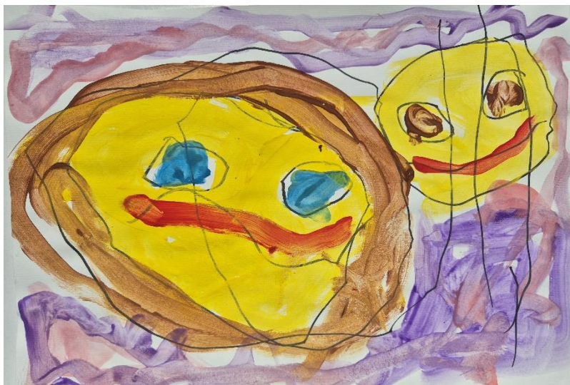
Sophia (3 leta), VVE Rogašovci, jasli 2

Spletna stran našega vrtca je: https://vrtecsvetijurij.splet.arnes.si/