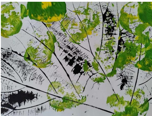
Bine (2 leti ); VVE Pertoča, jasli