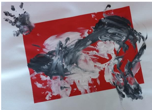
Jaka (1 leto); VVE Rogašovci, jasli 1