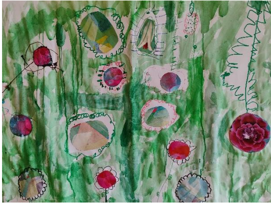
Skupinsko delo otrok, jasli VVE Pertoča