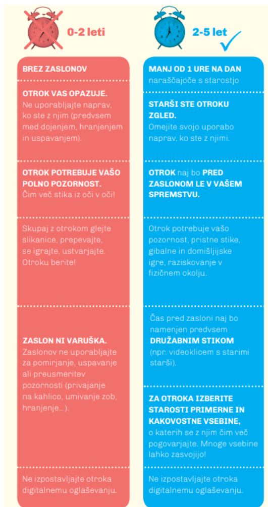
Slika 1. Časovna priporočila za uporabo zaslonov v predšolskem obdobju.