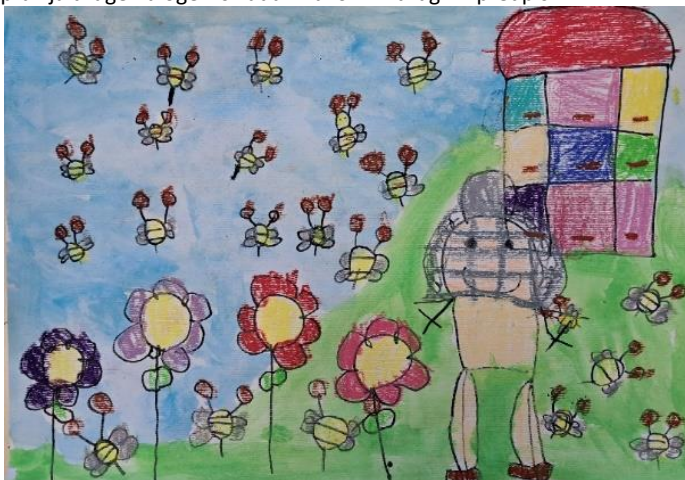
Vita (5 let); VVE Sveti Jurij, srednja skupina